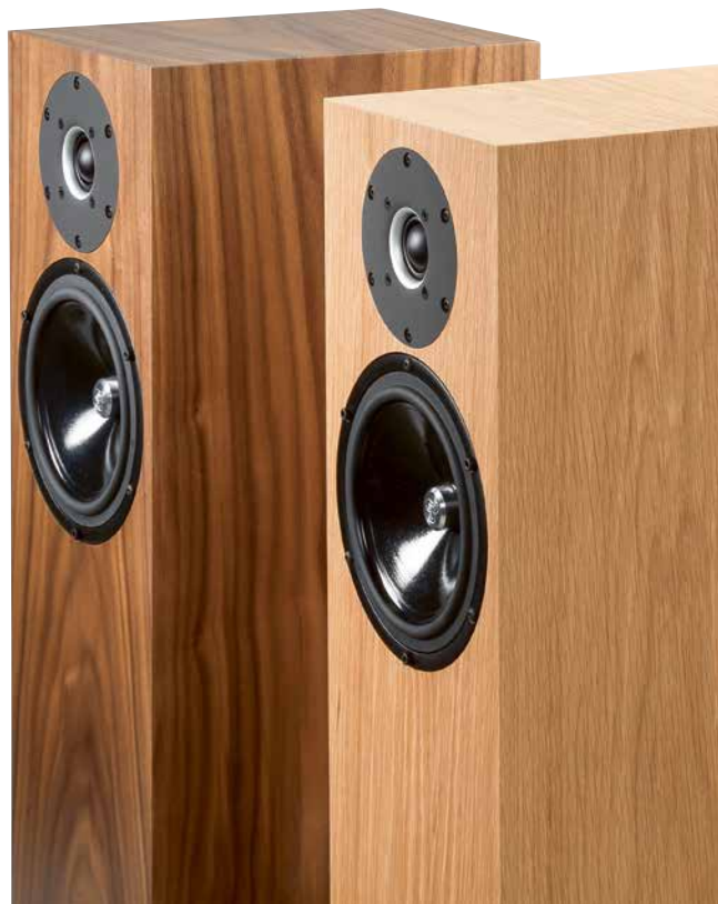
Egal, für welche Ausführung Sie sich entscheiden – die Furniere sind erstklassig.